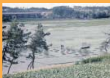
昭和30年頃の佐潟

今もコイ・フナ漁が行われ、そのようすを見ることができますが、社会が日々変化し佐潟と人の関わりも変化してきています。その歴史や現実をもとに佐潟での「賢明な利用」は大切なことだと確認し、新たな形で地元や市民の活動に引き継がれようとしています。